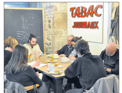
Tous réunis devant la même table emplies de pâtisseries maison, pour composer individuellement ce qu'il y a de plus juste ou de plus judicieux dans le choix des mots qui feront des chansons...