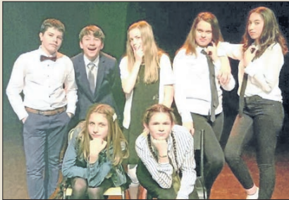
La troupe de l'Atelier Théâtre du collège

Mardi 12 février à 18 h 30, à La Baleine, L'Atelier théâtre du collège des Quatre-Saisons présente deux pièces humoristiques, Hyperland et Roméo kiffe Juliette.