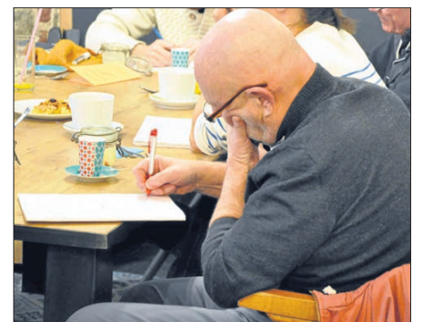
Brassens aimait passionnément les mots. Il les travaillait, les polissait. Ses textes sont de petits chefs-d'œuvre de la langue française. Les participants se sont concentrés sur leur propre écriture.